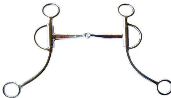
Bocado Filete largo 3BOCWLP125