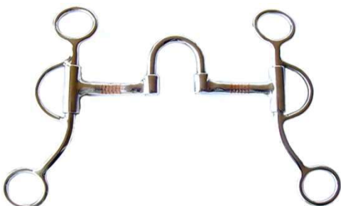
Bocado Correctional 3BOCWL125