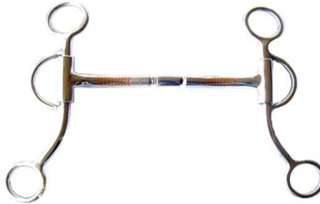
Bocado Billy Allen 3BOCWCBA125