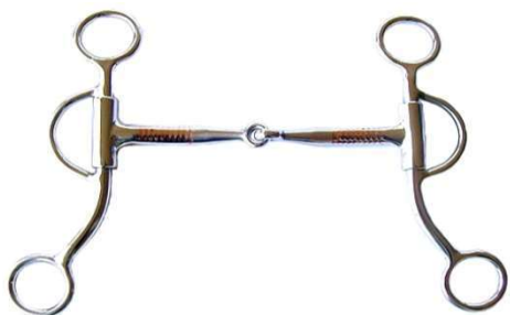
Bocado Filete corto 3BOCWCP125